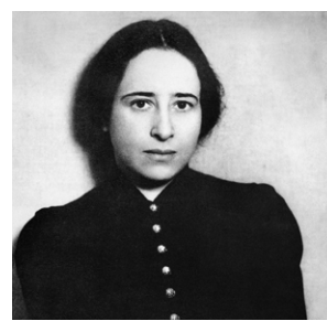
Hannah Arendt 1906-1975