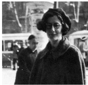
Simone Weil 1909-1943